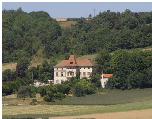
Au cœur du cratère d'Alleret, alt. 650m.